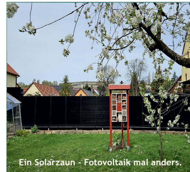
Ein Solarzaun - Fotovoltaik mal anders.

Dach- und Schieferarbeiten · Dachstühle · Carports · Vordächer Pergolen · Treppen · Decken · allgemeine Holzarbeiten · Restauration und Sanierung · historische Holzkonstruktionen · Sachverständigenleistungen