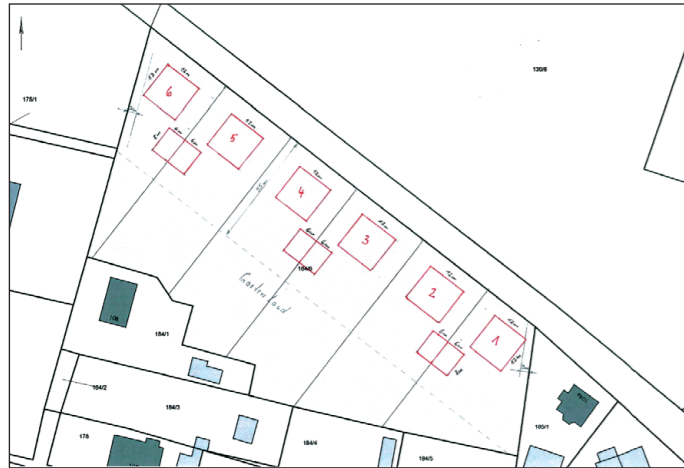
Lageplan B-Plan Zodel für Bekanntmachung

Der Geltungsbereich umfasst das Flurstück 184/6 der Flur 6 der Gemarkung Zodel.